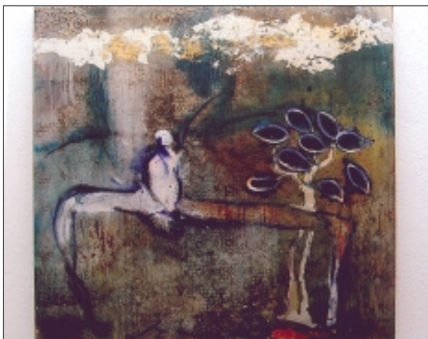
"Nueve hojas". S.E.

Por último, Pepa Santolaria observa que la universalidad de los sentimientos que la obra de Carrera Blecua refleja, hace posible que se produzca esa comunicación espiritual y poética que no conoce fronteras. "Ciertamente, Carrera Blecua ha sido entendido en Holanda, donde el público espera con expectación la presentación de su nueva obra", concluye.